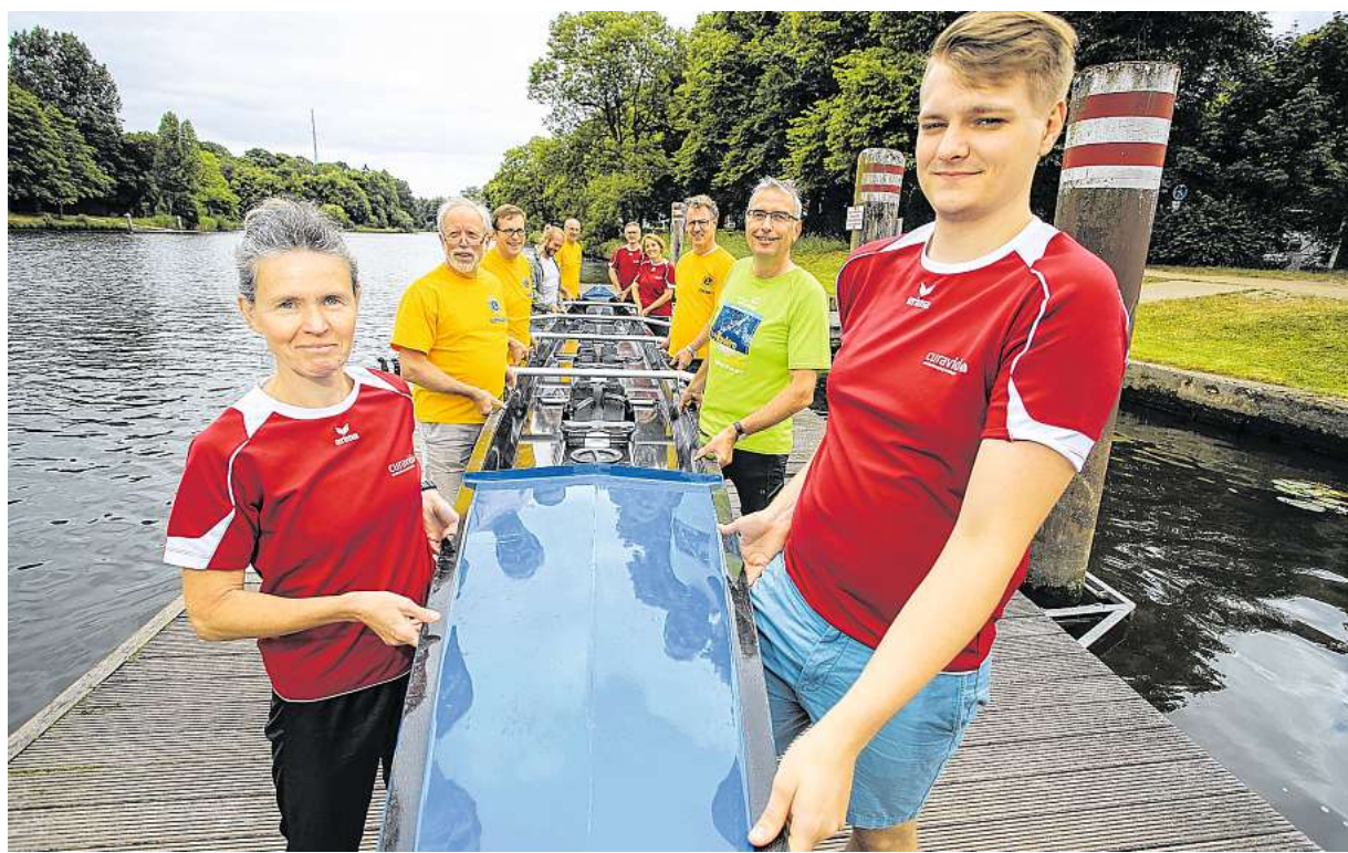
Mitarbeiter von Unternehmen und Klubmitglieder machen sich bereit für die Benefizregatta.